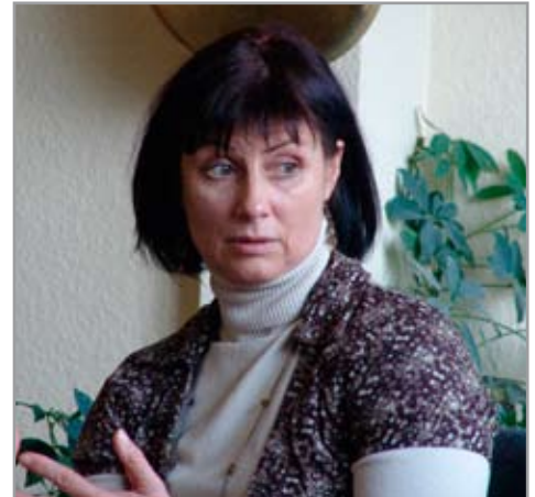
Impressionen aus den Workshops