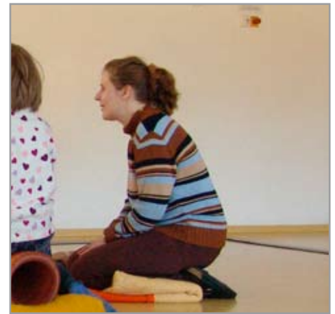
Aus dem Teilprojekt „Sprachförderung und Musik“