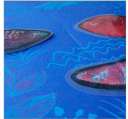
Impressionen aus den Workshops