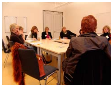
Impressionen aus den Foren der Tagung