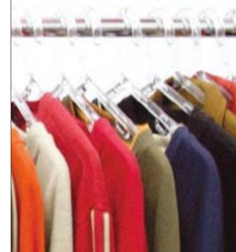
faire Klamotten? |

> www.inkota.de > www.saubere-kleidung.de